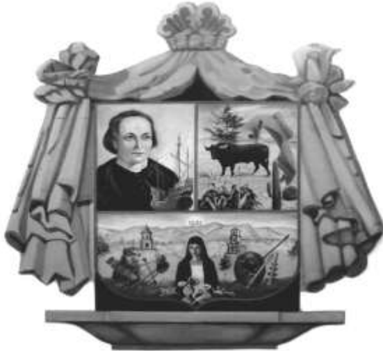
PRESIDENCIA MUNICIPAL COLÓN, QRO.

TERCERO: SE INSTRUYE AL SECRETARIO DEL H. AYUNTAMIENTO , PARA QUE PUBLIQUE EL PRESENTE ACUERDO EN LA GACETA MUNICIPAL.- - - - -